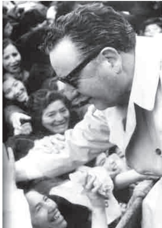
Allende recibe apoyo incondicional de las mujeres de San Felipe. Octubre de 1970

Se modernizará la estructura de las municipalidades reconociéndoles la autoridad que les corresponde de acuerdo