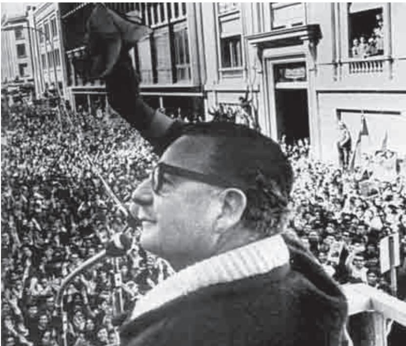
¡Demostrémosles que aquí están todos los trabajadores! El gobierno de Salvador Allende luchó por los derechos de las mujeres, protegió a los niños y transitó la dignidad cada día.