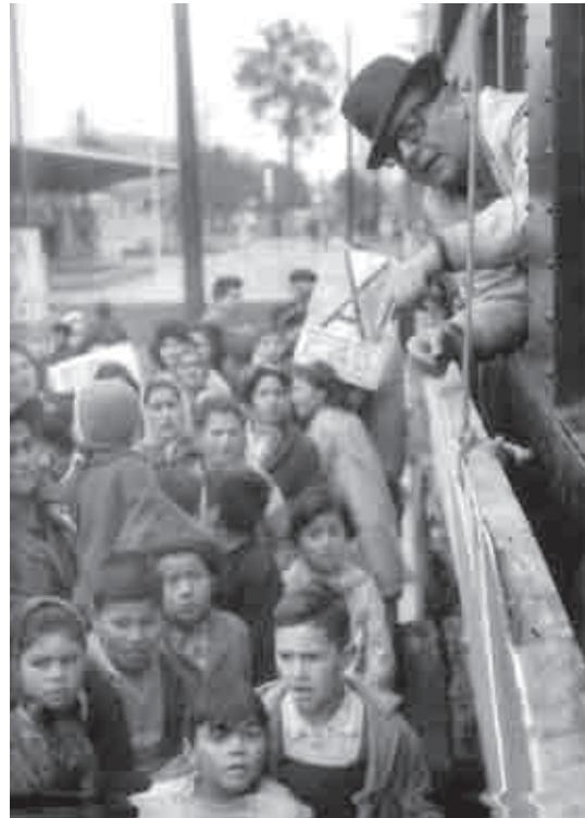
El candidato recorre Chile en el tren de La Victoria, 1963.

El principal instrumento a utilizar en el proceso de cambio, en estas condiciones, no podía ser otro que las clases revolucionarias de la sociedad, que para el efecto de convertirse en una alternativa real al sistema de dominación deberían ganar en organización y capacidad de movilización: “En nuestro país son más de tres millones de trabajadores, cuyas fuerzas productivas y su enorme capacidad constructiva, no podrán sin embargo expresarse dentro del actual sistema que sólo puede explotarles y someterles (...) Estas fuerzas, junto a todo el pueblo, movilizándolo a todos aquellos que no están comprometidos con el poder de los intereses reaccionarios, nacionales y extranjeros, o sea, mediante la acción unitaria y combativa de la inmensa mayoría de los chilenos, podrán romper las actuales estructuras y avanzar en la tarea de su liberación”.