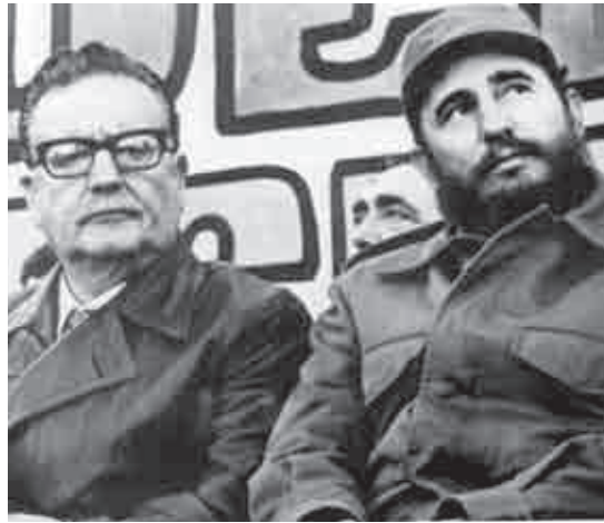
Salvador y Fidel en un acto de masas en Valparaíso.

de estas nuevas organizaciones, todo lo cual no podía sino determinar el surgimiento de un poder popular efectivo que, de desarrollarse el proceso, se convertiría en un poder alternativo al poder de la burguesía. Un poder que debería convertirse en el basamento necesario de una nueva organización social, es decir, que iría determinando la conjunción de condiciones que permitiría el paso a una etapa superior: la revolución socialista.