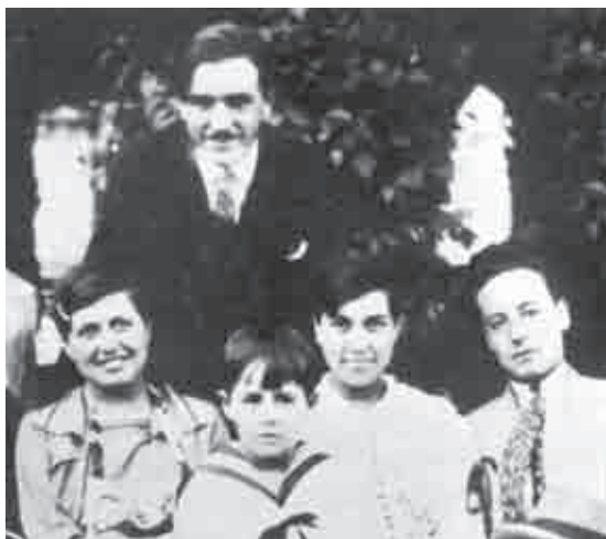
De niño con traje marinero. De joven, futuro médico de cuello y corbata (último a la derecha).