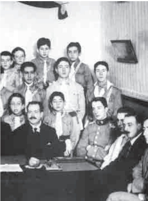
Salvador, muy joven, en uniforme, junto a un grupo de incipientes brigadas socialistas?